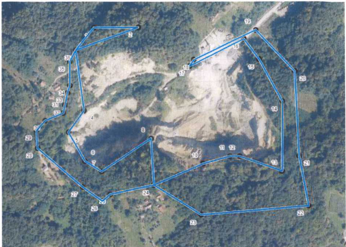
Grafički prikaz istražnog prostora tehničko-građevnog kamena "Sveti Križ 2"